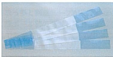
▲枚葉タイプ (手貼り用)